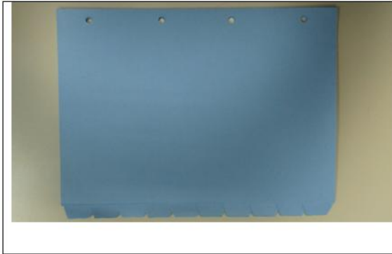
imagem 1 - Pacote fechado